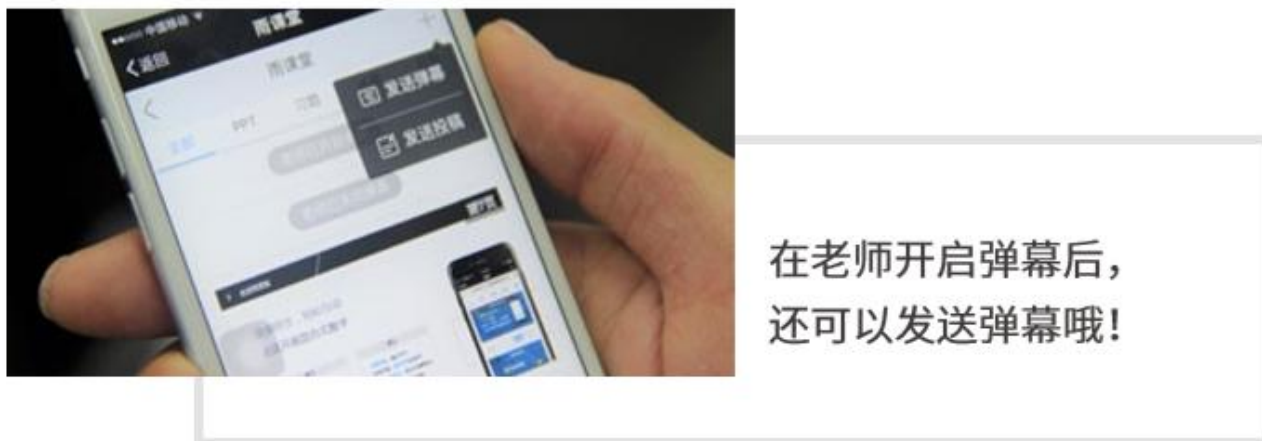
图 13 弹幕投稿操作

点击手机屏幕右上角的【+】，选择【发送投稿】，就可以随时发送图文消息给老师，如图 13 所示。