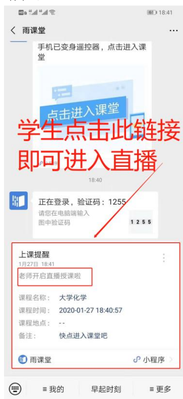
图 3 学生接收上课直播提醒

(1) 教师可在开启直播时给学生发送通知，学生可在微信公众号里收到直播提醒，点击此消息即可进入直播。如图 3 所示。