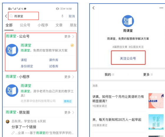
图 1 关注“雨课堂”