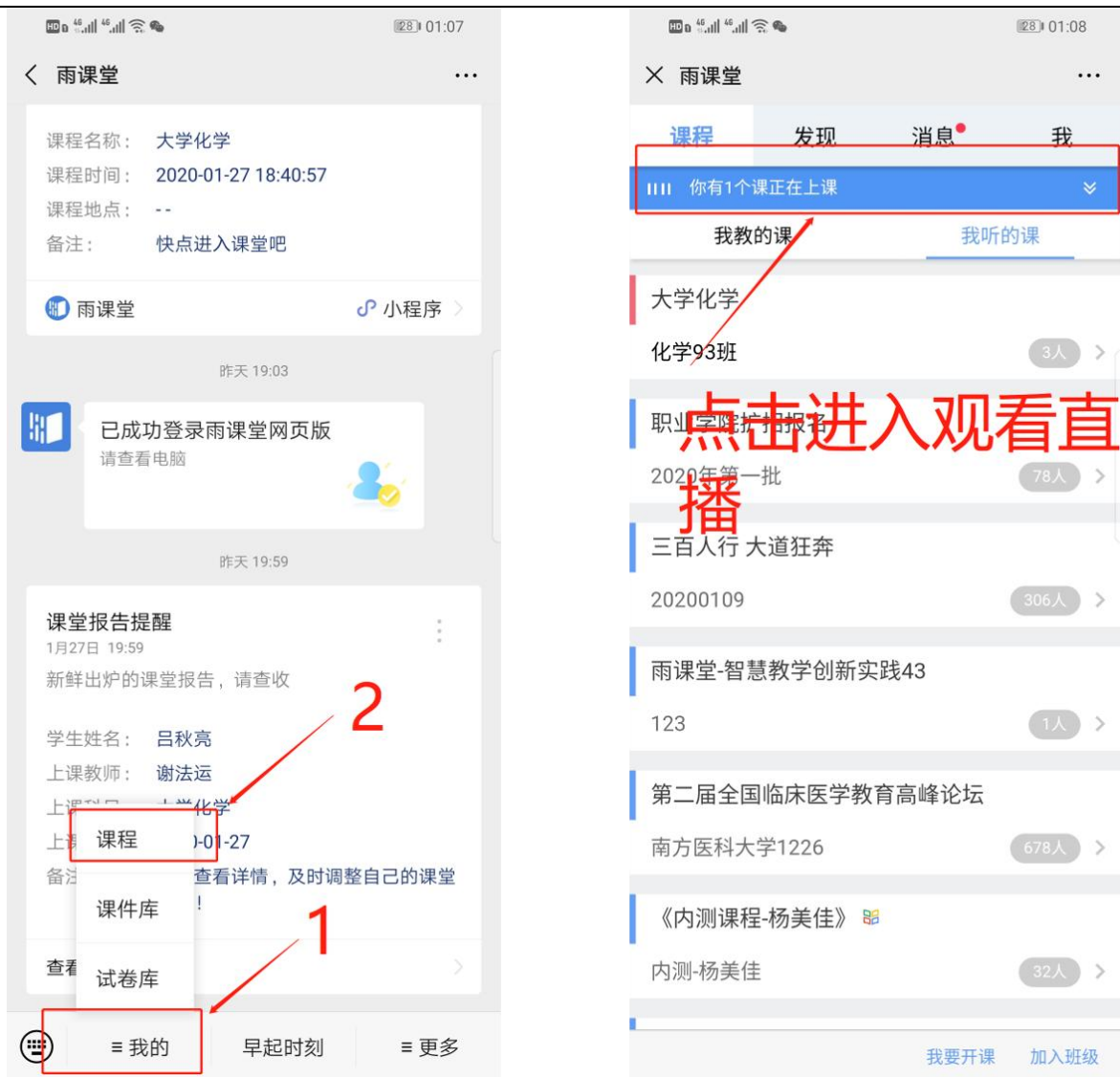
图 6 公众号进入直播

(4) 通过浏览器进入观看直播（推荐用 Chrome、火狐、360 浏览器等） 通过浏览器进入雨课堂网页版（ http://yuketang.cn ），点击右上角【登录网页版】， 如图 7 所示。之后用绑定了账号的微信扫码进入课程观看页面。