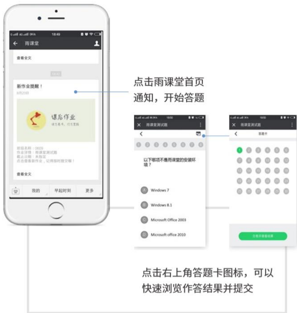
图 16 作业提醒