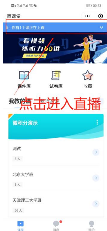
图 5 小程序进入直播界面