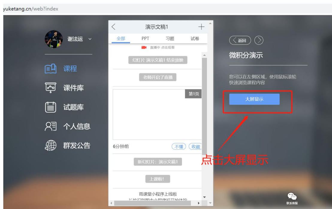
图 9 可进入大屏显示