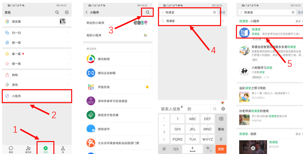
图 4 搜索进入雨课堂小程序