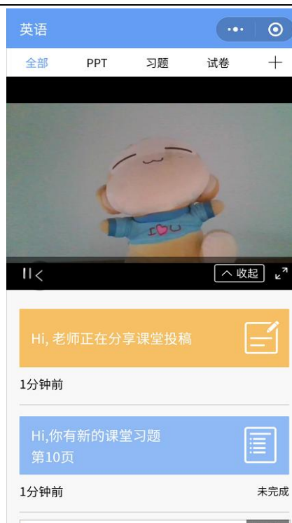
图 9 学生手机端直播预览效果